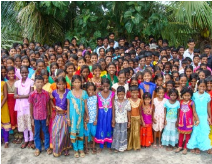
► Groepsfoto van gesponsorde Indiase kinderen

en volwassenen door middel van gebarentaal informeren over puberteit, seks en HIV. Op de Filipijnen steunen we programma's die dengue (knokkelkoorts) proberen onder controle te krijgen.