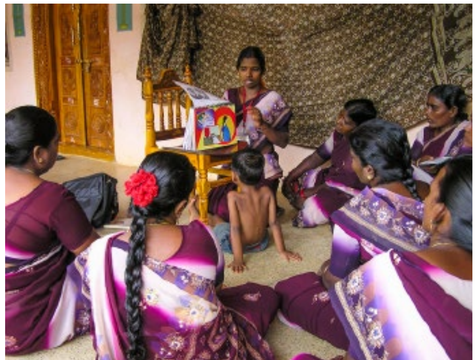
► Workshop voor vrouwen over HIV-risico's

MEER INFO: www.sahaya.eu EN www.sahaya.org . BEKIJK OOK DE KORTFILM OVER DE ORGANISATIE (INGESPROKEN DOOR JEREMY IRONS) OP www.sahayagoingbeyond.org .