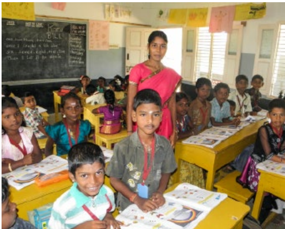
► Klas in de Mother Teresa School

hun systeem hebben dat de kans dat ze het overbrengen bij onveilige seks heel miniem is. Dat is een reden te meer om te proberen HIV-besmettingen zo snel mogelijk vast te stellen, zodat de juiste medicijnen verstrekt kunnen worden en de kans op verdere verspreiding vermindert. Uiteraard spelen een goede voorlichting en toegang tot voorbehoedsmiddelen ook een grote rol. In elk geval: wetenschappelijk gezien hebben we de nodige middelen om de klus te klaren. Wat nu vooral nodig is, is de wilskracht en het geld om dit allemaal uitgebreid toe te passen, tot in de verste uithoeken van de wereld. HIV/aids woekt echter op de zwaktes in de maatschappij. De bestrijding vergt dus niet enkel een louter medische, maar ook een sociale en politieke aanpak, waaronder een betere toepassing van de universele mensenrechten.