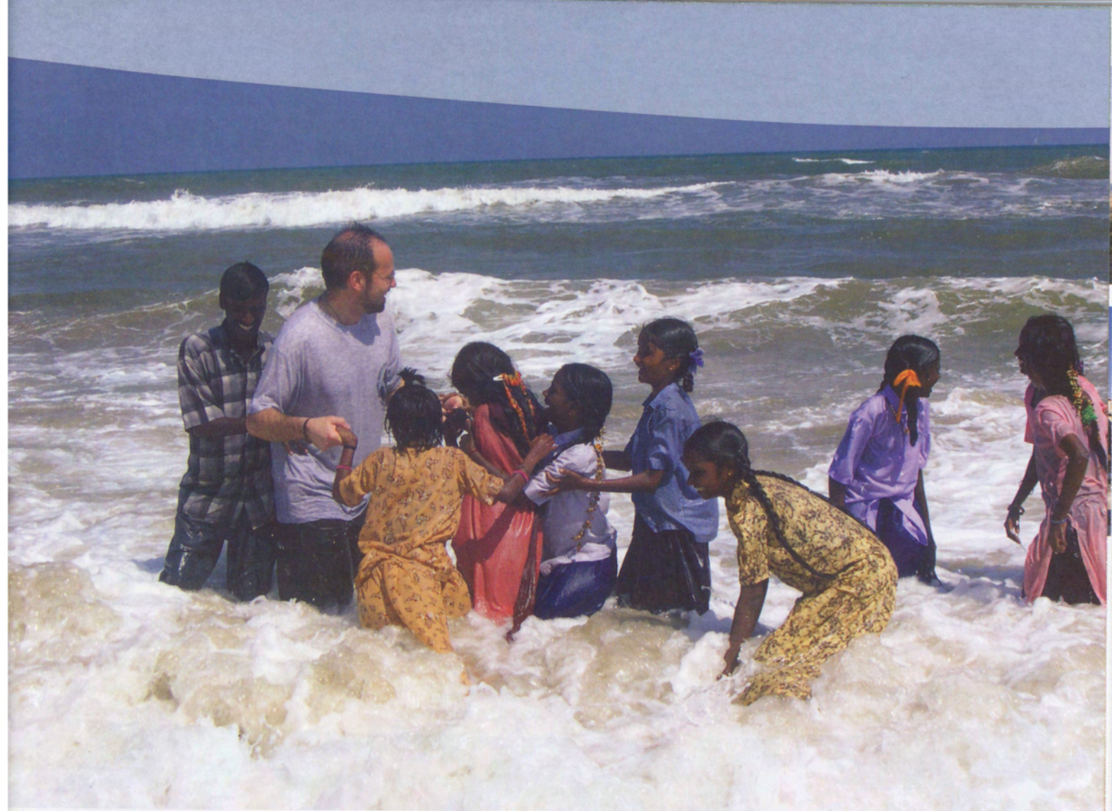
Onstuimig plezier maken in de Golf van Bengalen.

Primate Research Center van de UC Davis (University of California), waar niet-menselijke primaten als model worden gehanteerd voor research naar ernstige menselijke gezondheidsproblemen zoals aids en andere infectieziekten.