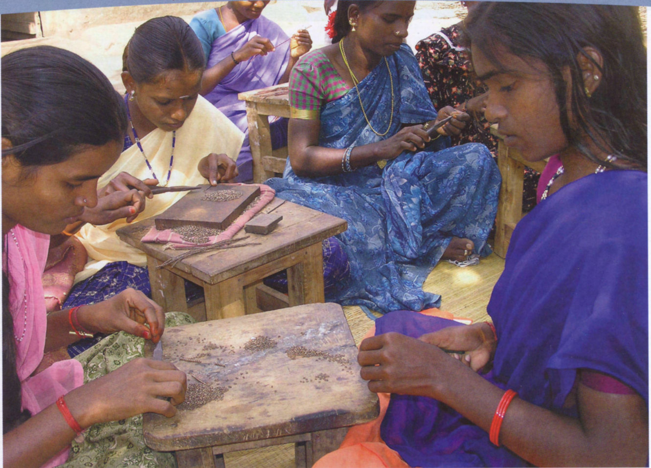
Jonge vrouwen maken koperen kettinkjes. Het levert hen elk 25 roepies (0,45 euro) per dag op.