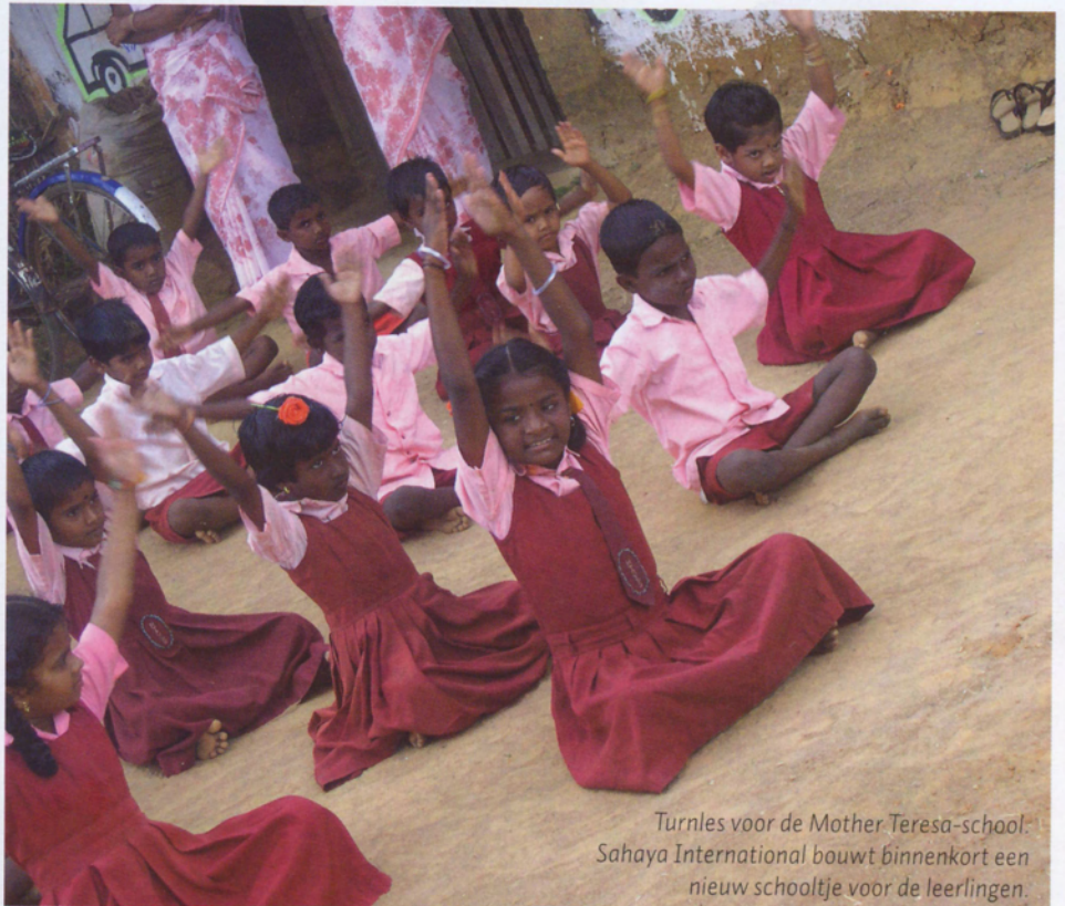
Turnles voor de Mother Teresa-school. Sahaya International bouwt binnenkort een nieuw schooltje voor de leerlingen.

Met een financieel steuntje van Sahaya krijgen hiv- en aidspatiënten weer zin in het leven. "We voelen ons sterker dan vroeger", vertelt een moedige vrouw. "Andere mensen hebben veel problemen, wij hebben er maar één."